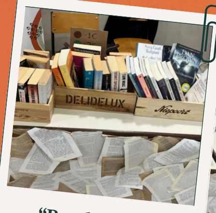
“Read & Give”

Nos dias 19 e 20, a feira do livro “Read & Give” voltou à entrada do F2, em parceria com a associação Heróis com Capa , para não só oferecer livros em segunda mão a preços simbólicos (entre 1 e 5 euros), como para oferecer marcadores exclusivos. Caso haja curiosidade para conhecer mais desta causa e o seu papel fundamental, recomendamos a leitura da nossa Newsletter de Outubro 2025 .